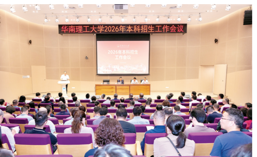
学校召开2026年本科招生工作会议

强大学目标,部署深化新一轮办学综合改革,要扎实推进本科招生培养改革,做强有组织人才培养。要坚持战略引领,深化化学专业供给侧结构性改革,前瞻性布局国家重大战略、战略性新兴产业、区域支柱产业等相关专业,持续推进专业结构优化;要坚持系统观念,持续推进招生培养就业一体化改革,确保教育链、人才链与产业链、创新链有机衔接;要坚持底线保障,夯实师资队伍和条件资源支撑;要坚持创新驱动,立体化推进招生宣传工作;要严守纪律红线,严格遵守国家和学校关于招生工作的各项纪律要求,严格执行相关招生政策和规定。 会上,土木与交通学院、自动化科学与工程学院、公共管理学院、湖北招生组以及江苏招生组分别做了经验分享。本科生院招生组负责人进行了工作部署和政策培训。大会表彰了2025年本科招生工作先进集体和个人。 学校党委常委、各机关部处主要负