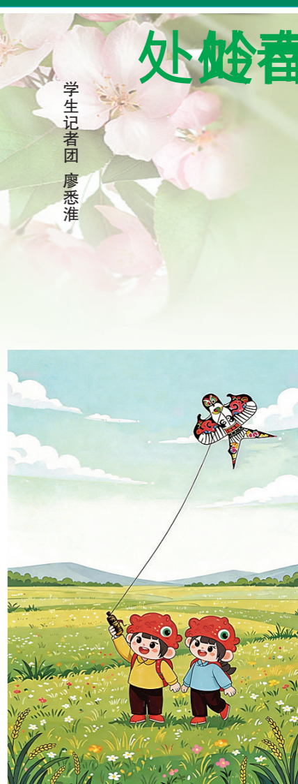
枝桠上，已经长出了嫩黄的新叶，卷着绿，像刚出生的婴儿攥着的小手，在阳光下闪着透亮的光。

但是那天，我第一次停下来，认真地看这些榕树。我才发现，原来春天的榕树，藏着最动人的秘密。深绿色的老叶子，正在簌簌地往下落，风一吹，就像下了一场绿色的雨，落在人行道上，铺了薄薄的一层。而在那些老叶子落下的