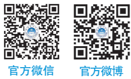
官方微信 官方微博