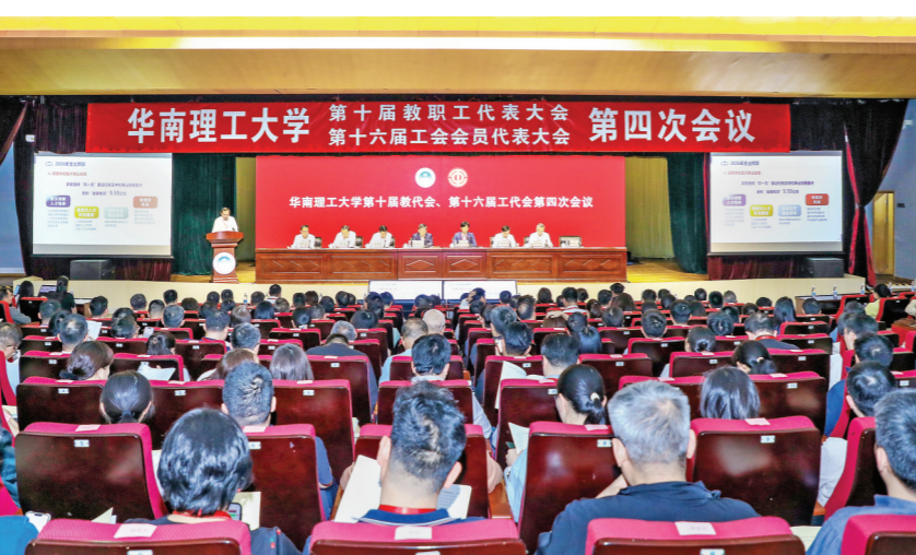
学校双代会第四次会议召开

二是坚持改革成就人才,持续优化助力师生成长成才的体制机制。要把“人”放在中心,深化“三学”改革,建立“资源跟着贡献走、平台围着人才建”的制度机制,让制度成为人才攀登的“脚手架”;要以本科教育审核评估整改为契机,在教学评价、学科专业优化调整、招生培养就业一体联动等方面持续深化改革,做卓越工程人才培养,真正为国家输出战略性资源;要改革评价制度和资源配置制度,构建以“四个重”为标志的科研创新体系,建立容错机制;要大力推进在地国际化和双向国际化